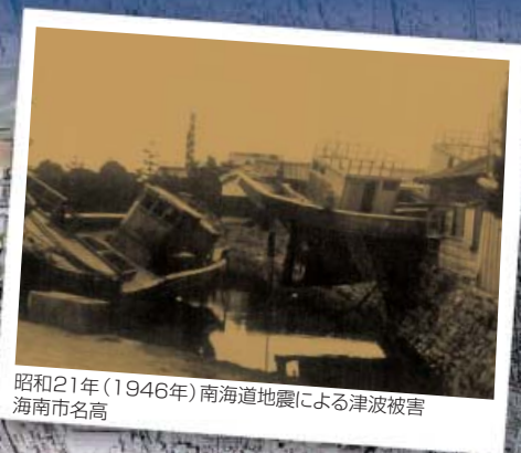
昭和21年(1946年)南海道地震による津波被害 海南市名高