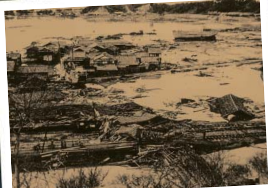
昭和21年(1946年)南海道地震による津波被害 紀伊新庄駅周辺