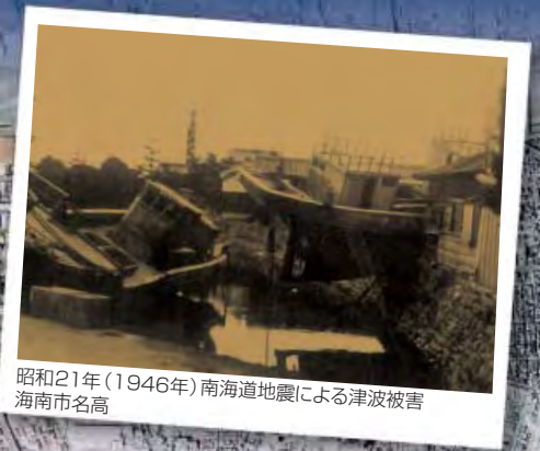
昭和21年(1946年)南海道地震による津波被害 海南市名高