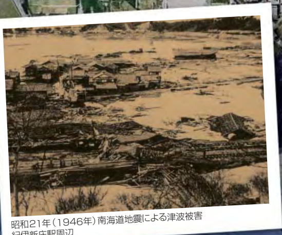
昭和21年(1946年)南海道地震による津波被害 紀伊新庄駅周辺